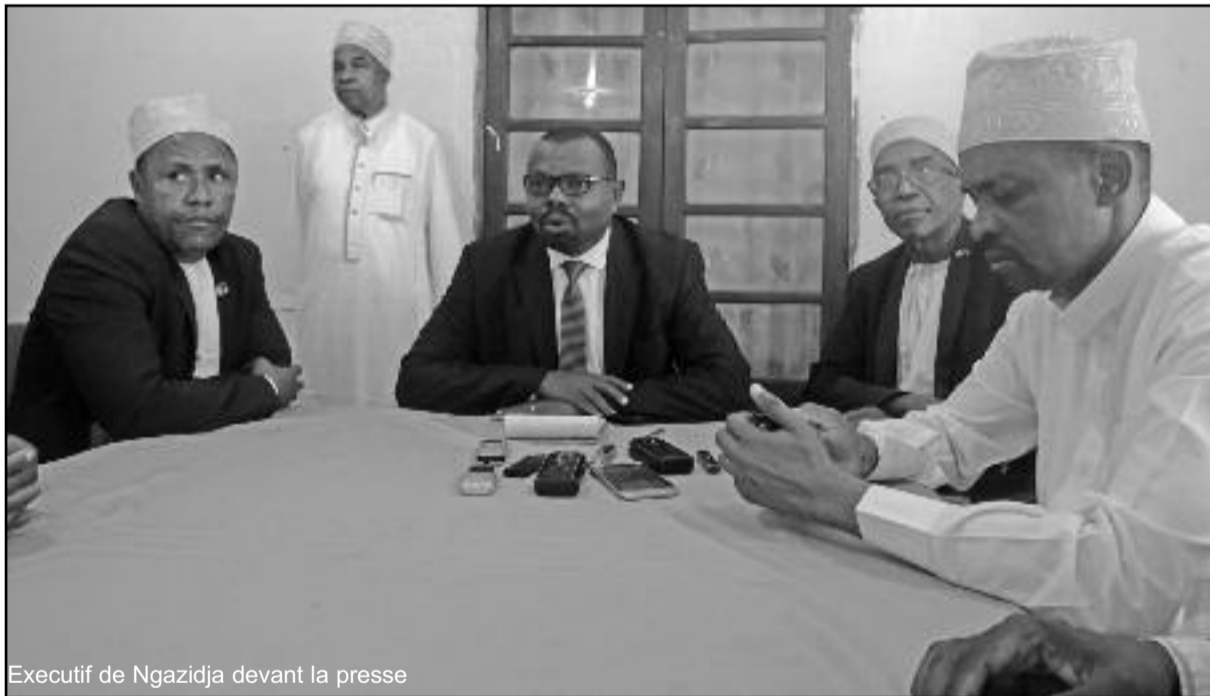
Executif de Ngazidja devant la presse