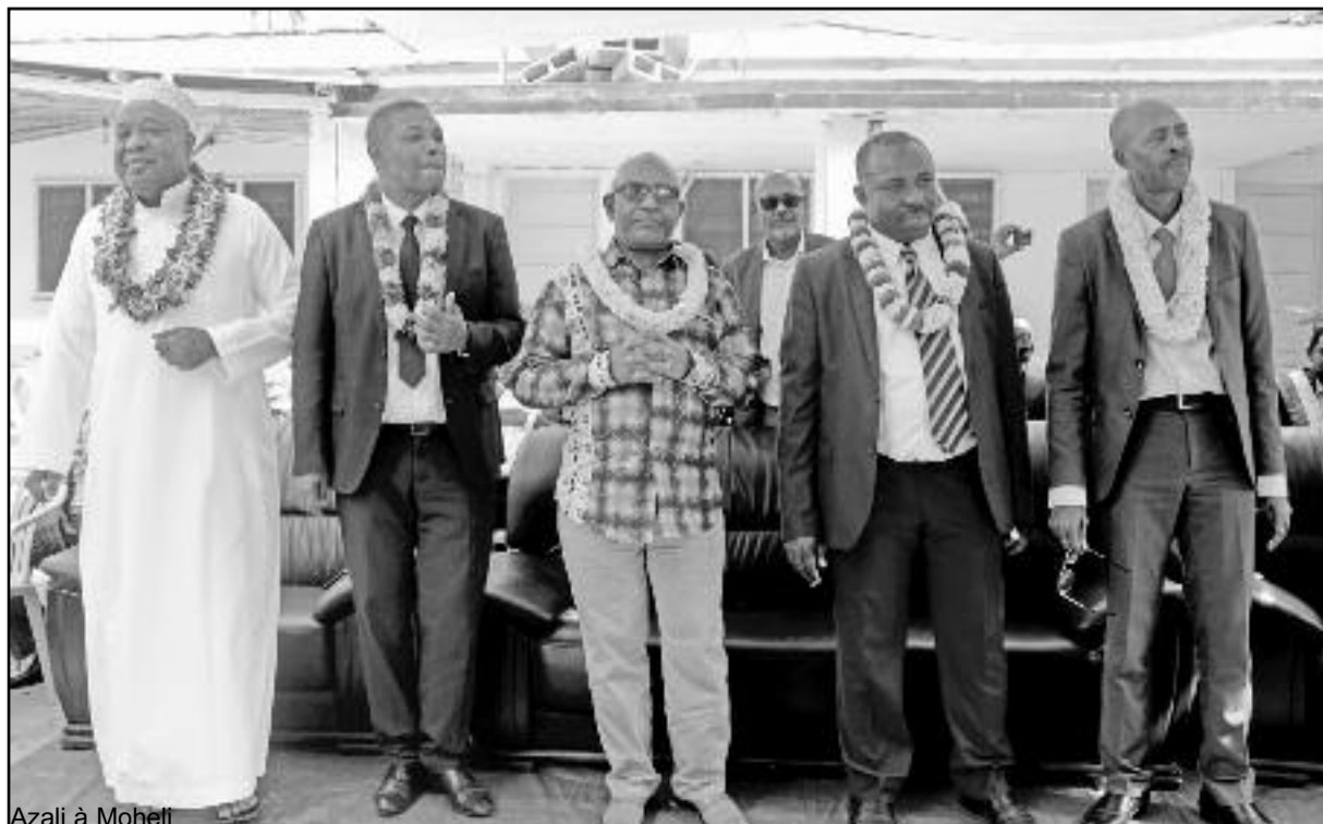
Azali à Mohéli