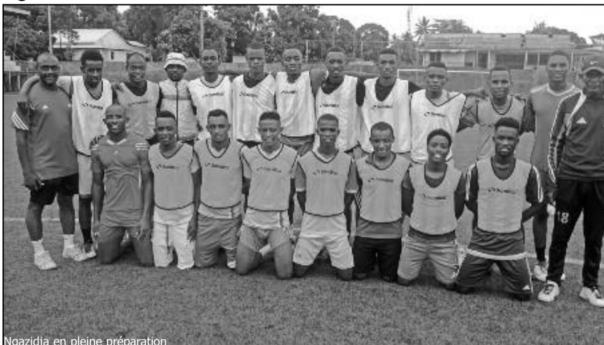
Ngazidja en pleine préparation