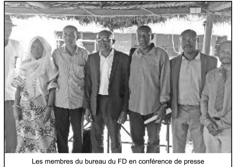
Les membres du bureau du FD en conférence de presse